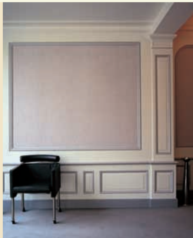
Gamme Trianon hauteur 60 pilastre ref 4407 - chapiteau de pilastre ref 4409 plate-bande ref 4403 - angle de plate-bande ref 4411